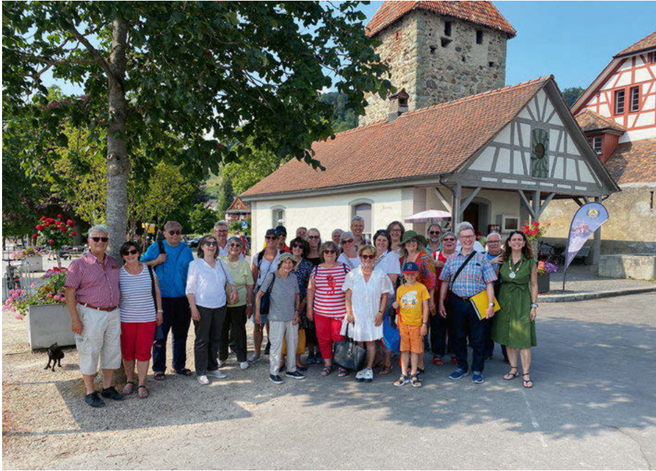
125-Jahre-Jubiläumsausflug an den Bodensee.