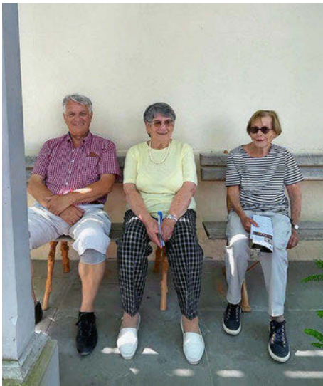
125-Jahre-Jubiläumsausflug zum Schloss Arenenberg, Samstag, 17. Juni 2023.