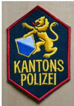
Das frühere Armabzeichen der Kantonspolizei Zürich und das Armabzeichen der Gemeindepolizei Küsnacht. Das Wort «Polizei» war auf der Achselpatte angebracht.