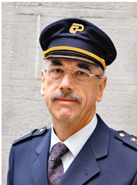
Der Autor als Polizeioffizier der Kantonspolizei anlässlich seiner Pensionierung im Oktober 2008.

«Die Notwendigkeit, ein Korps von Landjägern zu bilden», begründete die ausserordentliche Standeskommission 1804 mit der «Neigung des Zürcher Volkes zur Leidenschaft, Unruhe und Rebellion». Aufgrund dieses Antrages beschloss der Kleine Rat (Regierungsrat) am 9. Juni 1804: «Es solle mit möglichster Beförderung ein aus ungefähr 60 Mann bestehendes Landjäger-Corps für den hiesigen Canton aufgestellt und zum Dienst der Polizey gebraucht werden.» Die Eile, mit der die Aufstellung des Landjägerkorps betrieben wurde, hatte ihren guten Grund. Ruhe und Ordnung waren nach dem Ende des Bockenkrieges (1804) noch keineswegs hergestellt. In den folgenden Jahren wurden die Landjäger sukzessive über das Kantonsgebiet verteilt, wobei neben der Stadt Zürich primär die Bezirkshauptorte beschickt wurden.