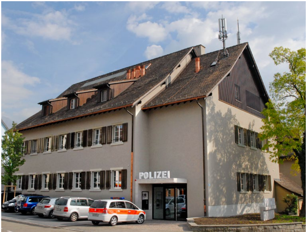
Der neue Polizeiposten von Küsnacht.

Als ehemaligem Vorsteher Liegenschaften und Kaderangehörigem der Kantonspolizei war mir bewusst, dass die Bevölkerung einen Polizeistandort, welcher regelmässige Öffnungszeiten garantiert, äusserst schätzen würde. Der Gemeinderat vertrat diese Haltung ebenfalls, und der Soverän stimmte im Jahre 2009 dem Kauf des «Swisscom-Gebäudes»