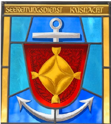
Die frühere Wappenscheibe des Seerettungsdienstes. Zurücktretende Seeretter erhielten die Wappenscheibe zur Verabschiedung.

dem Zweiten Weltkrieg, als den Seeretttern Uniformjacken und -hosen verpasst wurden, wie sie die Kantonspolizei trug. Dahinter stand nicht etwa der Wunsch, sich als Polizisten zu zeigen, sondern schlichte Sparsamkeit. Damals leisteten die in Küsnacht stationierten Kantonspolizisten aus Tradition freiwillig Seerettungsdienst. Und weil diese ja sowieso schon uniformiert waren, liess sich mit dieser gleichen Uniformwahl Geld sparen. Mit der Zeit jedoch erhielten die Seeretter eigene Uniformen mit dem Seeretter-Emblem. Der grosszügige verstorbene Gönner der Seeretter, Peter Knöpfel, übernahm die Kosten für einige Uniformstücke. Er wählte qualitativ hochwertige Pullover, Jacken und Hosen der Marke «Helly Hansen» aus.