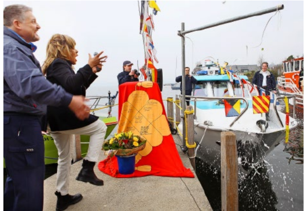
Im Beisein einer grossen Festgemeinde tauft die Sängerin Tina Turner das Boot ZH 355 auf den Namen «Tina».

Namen «Tina» getauft. Für Einsätze in Ufernähe oder flachen Gewässern verfügt der SRDK seit den 1980er-Jahren über einen Weidling mit Aussenbordmotor. Dieser wurde im November 2007 durch das neue Arbeitsboot «Nepta» ersetzt. Das Boot, von der Firma Müller, Spiez, gebaut, wird durch zwei leistungsstarke Aussenbordmotoren angetrieben. Es verfügt über eine herunterklappbare Einstiegsrampe am Bug und eignet sich sehr gut für die Einsätze der Tauchgruppe sowie den Transport der mobilen Ölsperren, welche insbesondere bei Verschmutzung unserer Dorfbäche zum Einsatz gelangen.