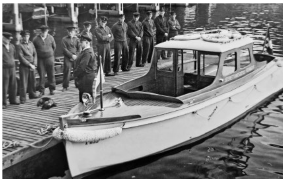
Taufe des neuen Seerettungsbootes «K2» mit der Bezeichnung «Z 355» in der Steinburghaab.