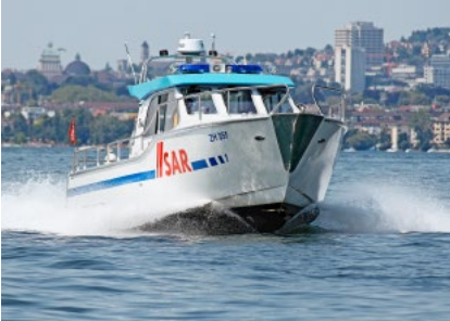
Die neue ZH 355 auf einer ihrer vielen Testfahrten.