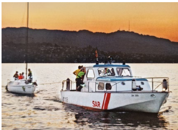
Die bewährte ZH 355 beim Abschleppen eines Segelbootes.

Nach über 45 klaglosen Dienstjahren zeigten sich bei der treuen «Küsnacht 3 – alias «355er» Alterserscheinungen. Ab Sommer 2009 befasste sich eine Gruppe aus erfahrenen Seerettern unter Leitung von Markus Ehrat mit der Beschaffung eines neuen Einsatzbootes. Nach einer langen Evaluationsphase entschieden sich die Verantwortlichen (damaliger Sicherheitsvorsteher Arnold Reithaar) für ein Boot vom Typ «Loon Patrol 1190» der auf Aluminiumbau spezialisierten Werft Loon-Yachts in Arth SZ. Der Bau des Bootes zeigte sich als schwierig und hürdenreich. Mit 11,9 Metern Länge und einem Gewicht von 8,9 Tonnen ist das neue Dienstboot etwas weniger lang und schwer als sein Vorgänger. Mit seinen zwei Yanmar Sechszylinder-Dieselmotoren zu je 440 PS erreicht das Schiff eine Geschwindigkeit von 32 Knoten, oder knapp 60 km/h. Ein solches auf hohe Leistungs- und Sicherheitsanforderungen getrimmtes Boot hat natürlich auch seinen Preis. Die budgetierten Gesamtkosten von 860 000 Franken konnten einigermaßen eingehalten werden. Schiffstauen spielen in der Seefahrt seit alters her eine wichtige Rolle. Am Nachmittag des 6. April 2013 wurde die «Küsnacht 4» von der in Küsnacht wohnhaften Queen of Rock'n'Roll, Tina Turner, im feierlichen Rahmen auf den