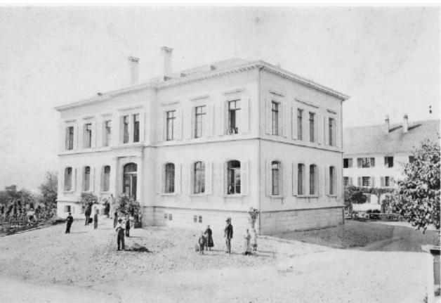
Ein Meilenstein für die Gemeinde Küsnacht und den Verein: Das 1875 erbaute Schulhaus an der Wiltisgasse. Bei seiner Einweihung wurde der Frauenverein Küsnacht erstmals offiziell erwähnt.