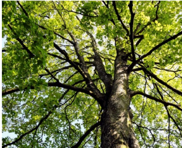
Bitz-Ahorn = Alpenahorn.