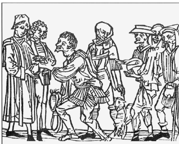
Begleichung von Schulden im Mittelalter mittels Naturalien.