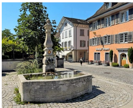
Seminarbrunnen heute.

Die folgende Zeit wird von Redner Bruppacher in Bezug auf vorhandene Urkunden als Periode ohne grössere Bedeutung für die Waldbewirtschaftung bezeichnet, ausser dass sich auch die Holzleute von Küsnacht inzwischen zu einer rechtlich auftretenden Gesellschaft oder Korporation zusammengeschlossen haben.