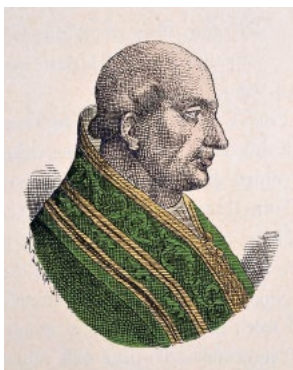
Papst Clements III., 1187–1191.