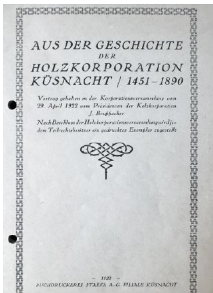
Die 18-seitige Broschüre.