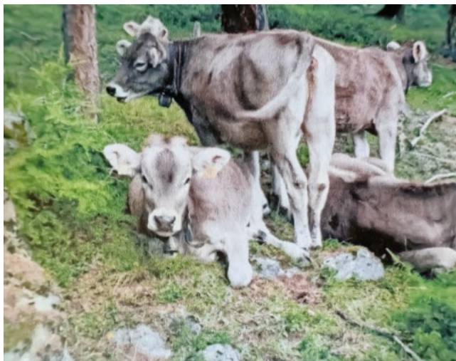
Im Wald weidendes Vieh war im 17./18. Jahrhundert keine Seltenheit.

Aus einem Protokoll vom 13. Dezember 1804 geht hervor, dass die Holzgenossen auch eine Zuchtstiergenossenschaft unterhielten, denn da ist die Rede davon, dass die Kuhherde im Wald nur mit einem Zuchtstier ( S. V. salva venia ) versehen gewesen sei, wodurch grosser Schaden zum Nachteil der Bürger erwachsen sei. So wurde beschlossen, dass «... zwei Zuchtstiere von hübscher und guter Art alljährlich von den Holzleuten angeschafft...» werden. Im Weiteren wurde festgelegt, dass pro Kuh in der Kalberweide und pro Jahr 10 Schillinge bezahlt werden mussten, und Nichtmitglieder der Holzgenossen-