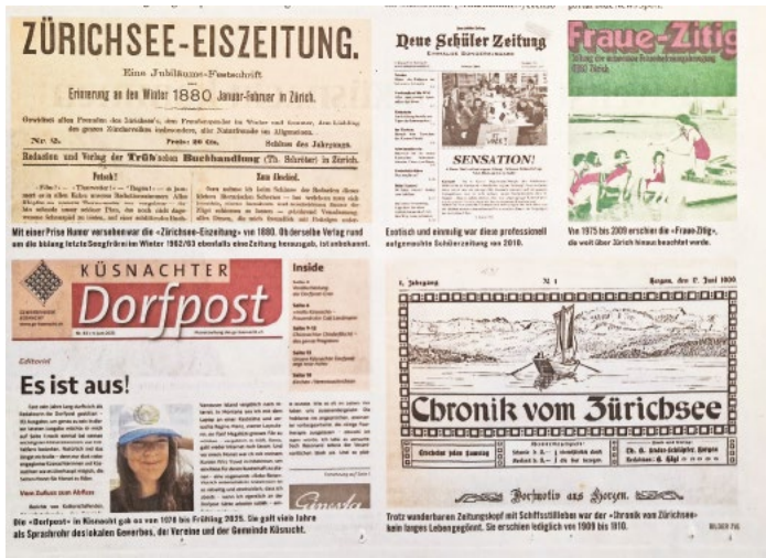
Die letzte Ausgabe mit Erinnerungen aus früheren Zeiten.

wie viele andere Printmedien, schon länger nicht mehr wirtschaftlich tragbar, weshalb die GV des Gewerbevereins den Entscheid zur Einstellung fällte. Nummer 433 ist die letzte Ausgabe der Zeitung. Wenige Wochen später wurde der «Küsnachter» durch den «Küsnachter Boten» abgelöst.