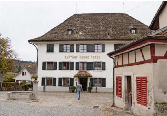
Der historisch bedeutsame Landgasthof Krone Forch, dessen Renovation nun gesichert ist.

kommunalen Vorlagen wurden deutlich angenommen: 80 respektive 84 Prozent Zustimmung erhielten die Alterswohnungsprojekte Rebweg und Wangensbach. Der Erweiterungsbau des Schulhauses Heslibach erhielt 63 Prozent Ja-Stimmen und 66 Prozent der Abstimmenden machten sich für die Erhöhung der Kinderkrippen-Subventionen stark.