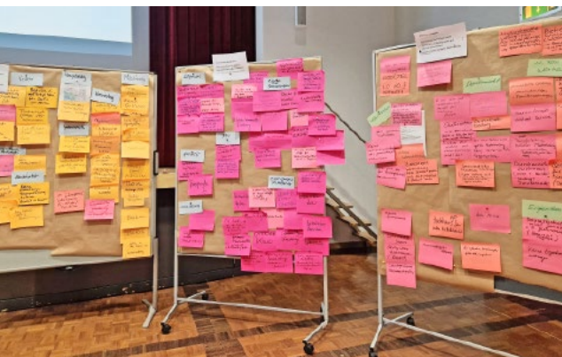
Die Teilnehmenden am Mitwirkungsverfahren «Entwicklung Hörnliareal» haben auf Zetteln vielfältigste Ideen eingebracht.