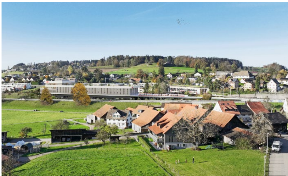
Gesamtansicht des geplanten Instandhaltungszentrums (Fotomontage).

Die Forchbahn AG plant den Bau eines neuen, zentralen Instandhaltungszentrums auf der Forch, um das bestehende Depot aus dem Jahr 1969 zu ersetzen. Der vorgesehene Standort liegt auf dem gemeindeeigenen Grundstück Unterboden zwischen der Forchautobahn und der Kaltensteinstrasse. Weite Teile der Bevölkerung im Künsnacherberg wehren sich gegen die Realisierung dieses Bauvorhabens und gründeten den Verein «Zukunft Forch». Insbesondere wird moniert, dass das voluminöse Gebäude in keiner Weise in das Ortsbild passe. Gemäss Forchbahn AG wird die Projektierung weiter vertieft.