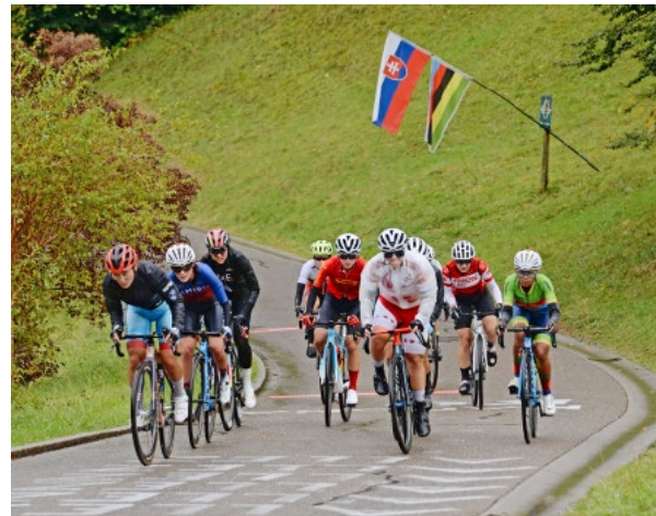
Strassenrennen der Frauen, ein Teil des Feldes im Aufstieg von der Tobelmüli.

Am ersten Wochenende der Rad-WM verkaufte der Lions Club Küsnacht an der Küsnachter Rennstrecke Grillwürste. Rund 2500 Franken war der Reinerlös, welcher an den Zürcher Verein Incontro ging, der sich für Menschen am Rand unserer Gesellschaft alltagspraktisch einsetzt.