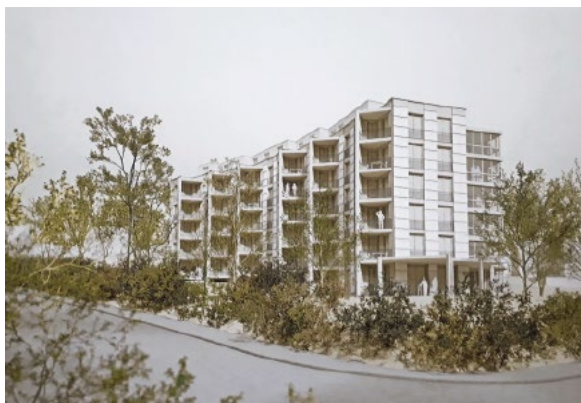
Der geplante Alterswohnungen-Ersatzneubau am Rebweg 3 mit 60 unterschiedlichen Wohnungen (vormals Schiedhaldenstrasse 74).

Über vier Vorlagen galt es am 18. Mai abzustimmen: über die Baukredite für die Ersatzneubauten Alterswohnen Rebweg (vormals Tägermoos) und Wangensbach, über den Erweiterungsbau der Schulanlage Heslibach sowie über die Erhöhung der Kinderkrippensubventionen. Alle vier