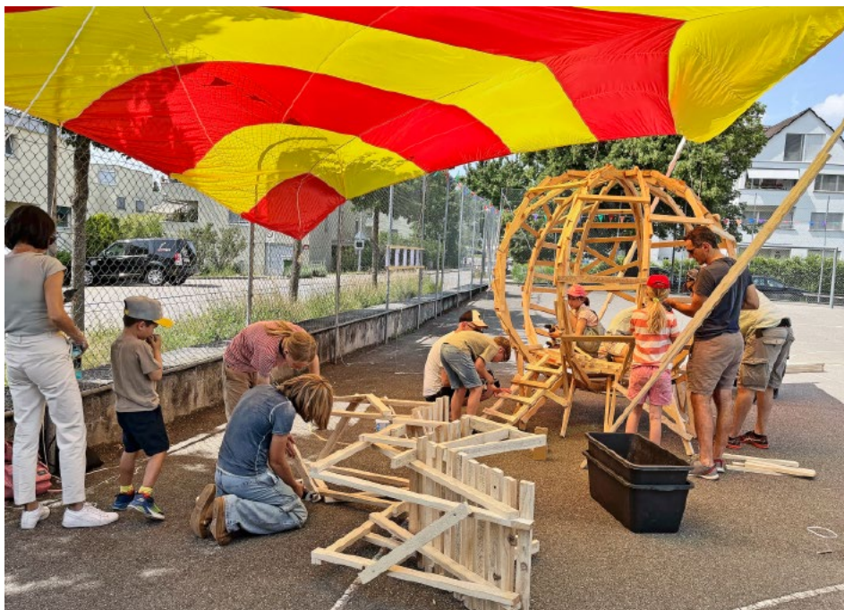
Vielfältige Herausforderungen beim Frezli-Jubiläum.

Rund 400 Besucherinnen und Besucher waren im Juni in der Freizeitanlage Heslibach anzutreffen, diese feierte ihren 60. Geburtstag. Die Freizeitanlage Heslibach, ursprünglich ein Jugendzentrum, war die erste Freizeitanlage in Küssnacht. Später kamen Itschnach und Sunnemetzg dazu und die Erwachsenenbildung ist Teil der Freizeitanlagen. Im Heslibach steht das gestalterische Handwerk mit seinen Werk- und Keramikateliers sowie der Holzwerkstatt im Zentrum.