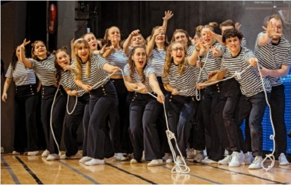
Die Crew auf dem Schiff Bonnie M.