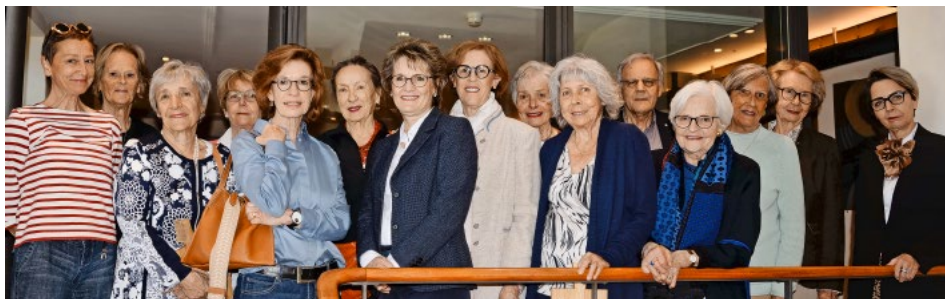
Vorstand und Team Brockenstube des Frauenvereins.

Anfangs April konnte der Küssnachter Frauenverein seine 150. Generalversammlung abhalten. Das Hotel Sonne bot dafür einen würdigen Rahmen. Rund 350 Frauen sind Mitglied im Verein und pflegen die Gemeinschaft auf Ausflügen, Vorträgen und Führungen oder in Sprachkursen und thematischen Gruppen zu Literatur, Kino, Restaurants oder Handarbeit. Der Verein unterstützt mit jährlichen Vergabungen gemeinnützige Organisationen.