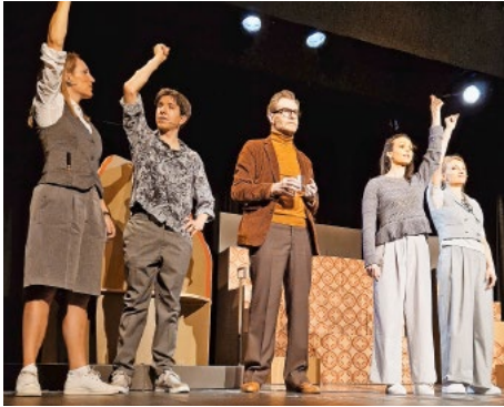
Theaterverein Kulisse in Aktion.