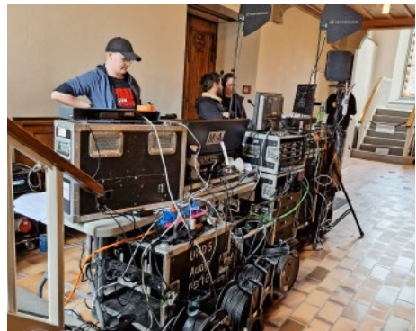
Vorbereitung auf den SRF-Gottesdienst.