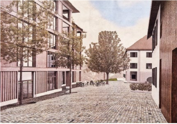
So wird der Ersatzneubau im Wangensbach (links im Bild) aussehen.