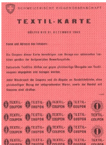
Textil-Karte für Unterwäsche, Oberbekleidung, Bettwäsche, Tücher, Decken usw. in verschiedenen Materialien.