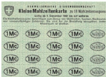
Mahlzeitenkarte mit Coupons: für Morgenessen 1 Coupon, für Mittag und Abendessen je 2 Coupons in Restaurants oder Hotels.