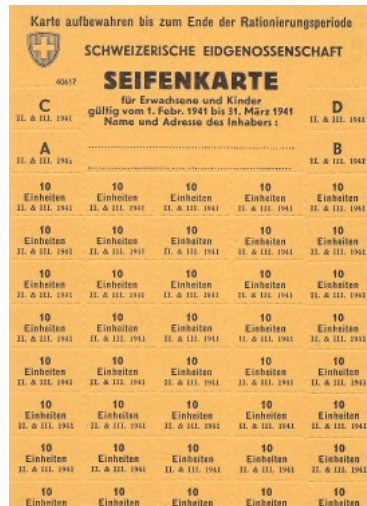
Seifenkarten für die Körperpflege, Hygiene und die Wäsche. Ab Februar 1941 bis Juli 1947 wurden total 37 verschiedene Karten für Frauen, Männer, Kinder und Familien ausgegeben.