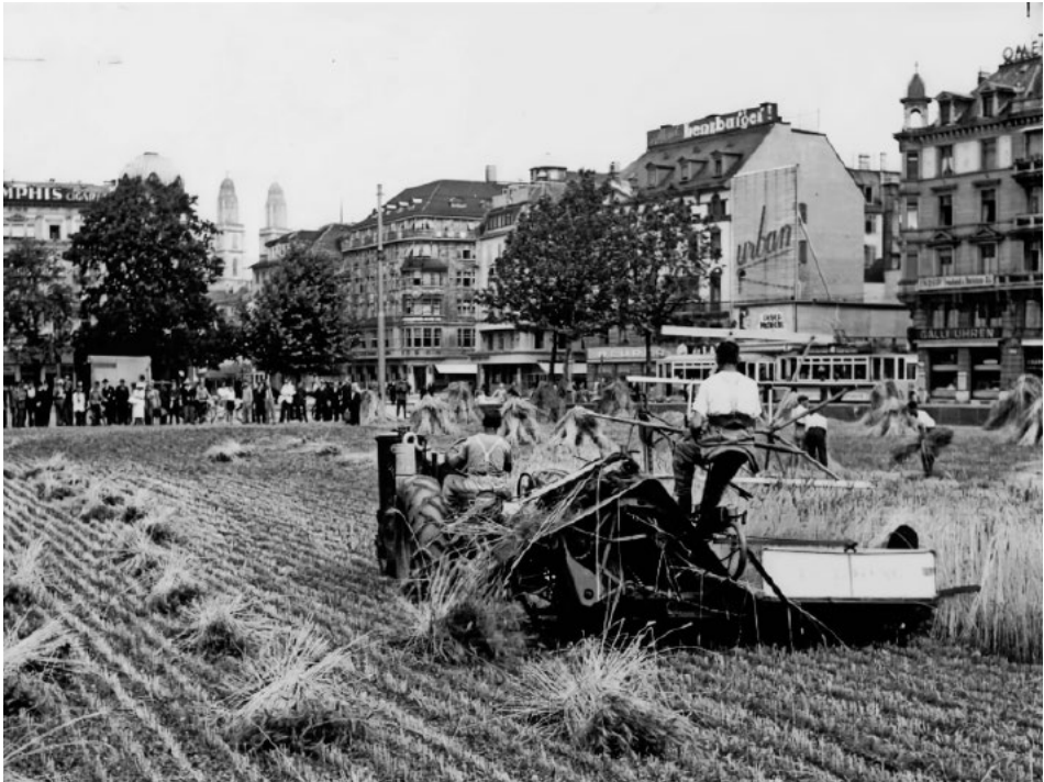
Abb. 1: Anbauschlacht, Bellevue Zürich.