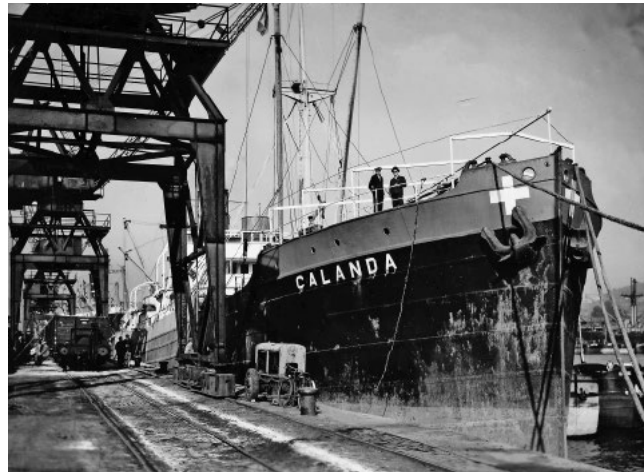
Abb. 9: Die «Calanda» war das erste Hochseeschiff unter Schweizer Flagge. Sie wurde 1941 von der neu gegründeten Schweizerischen Reederei AG in Basel betrieben und diente während des Zweiten Weltkriegs dem neutralen Warentransport. Die Reederei agierte unter Aufsicht des Kriegs-Transport-Amtes (KTA) in Bern, das für die Koordination der schweizerischen Hochseeschifffahrt zuständig war.

Auch dieses Kapitel ist in Sprengers Sammlung dokumentiert: mit offiziellen Mitteilungen, Zeitungsartikeln und philatelistischen Zeugnissen, die die Gründung und die Schicksale der Schiffe nachzeichnen. Sie verdeutlichen, wie die neutrale Schweiz auch auf hoher See Wege fand, in einer blockierten Welt handlungsfähig zu bleiben. Die Eidgenossenschaft reagierte damit auf blockierte Handelswege und gründete eine kleine, aber funktionstüchtige Handelsmarine. Sprengers Sammlung enthält Belege zu dieser logistischen Ausnahmesituation – dem Aufbau einer eigenen Hochseeflotte durch ein Binnenland –, deren Bedeutung für die Aufrechterhaltung der Versorgungssicherheit bis heute unterschätzt wird.